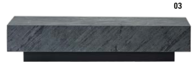
03. Couchtisch Contur® Pavia H 204 solider Steinfurnier-Couchtisch mit festem Stand und massig Platz. MDF Sockel mit Rollen, BHT ca. 120x26x70 cm.