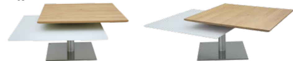
05 Couchtisch Contur® Pavia H 509, drehbar, obere Tischplatte in Wildeiche massiv bianco geölt und gewachst, BT ca. 75x75 cm, untere Tischplatte in reinweiß unterlackiert mit Nanostruktur, BT ca. 75x75 cm, Säule und Bodenplatte in gebürstetem Edelstahl, BHT ca. 114x38x75 cm.