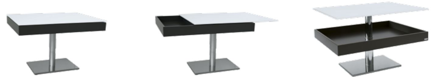
04. Couchtisch Contur® Pavia K 396 höhenverstellbar und seitlich ausziehbar, Glasplatte Optiwhite, reinweiß unterlackiert mit Nanostruktur, Korpus in umbragrau lackiert, Säule in perlglanz verchromt, Sockel aus gebürstetem Edelstahl, BHT ca. 90x40x70 cm, seitlich ausziehbar auf ca. 115x40x70 cm, Höhenverstellung ca. 40 bis 57 cm