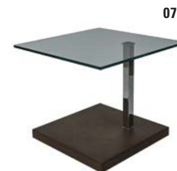
07. Beistelltisch Contur® K 926 , rollbar, 10 mm Platte Floatglas, ESG, Metallteile hochglanz verchromt, Sockel MDF Betonoptik rost, BHT ca. 60x64x60 cm, höhenverstellbar ca. 44-64 cm