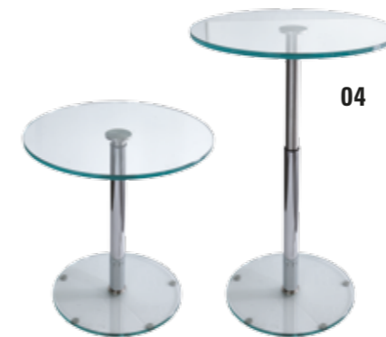
04. Contur® K 437 , Beistelltisch, drehbar und höhenverstellbar in ca. 50 cm und ca. 73 cm Höhe. Platte und Sockel aus Glas, ø 35 cm, Stärke ca. 12 mm, BHT ca. 45 x 73 x 45 cm