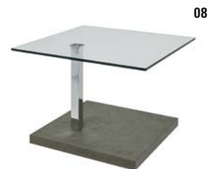
08. Beistelltisch Contur® K 929 , rollbar, 10 mm Platte Floatglas, ESG, Metallteile hochglanz verchromt, Sockel MDF Betonoptik light, BHT ca. 60x65x45 cm, höhenverstellbar ca. 45-65 cm