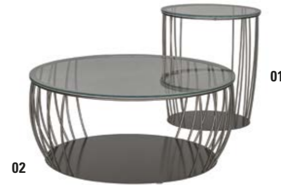
01. Couchtisch Contur® Pavia Anna Sykora , Platte ESG Parsolglas, 10 mm, in tiefschwarz, mit Ringoptik, Gestell Stahl schwarz gepulvert, Ø ca. 45 cm H ca. 53 cm. 02. Couchtisch Contur® Pavia Anna Sykora , Platte ESG Parsolglas, 10 mm, in tiefschwarz, mit Ringoptik, Gestell Stahl schwarz gepulvert, Ø ca. 80 cm, H ca. 40 cm.