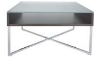
02. Beistelltisch Contur® K 453, Platte Glas optiwhite mit Nanostruktur, Glas ca. 10 mm, Kreuzgestell hochglanz verchromt, Korpus MDF in graubraun lackiert, BHT ca. 40x55x40 cm. 03. Beistelltisch Contur® K 452, Platte Glas optiwhite mit Nanostruktur ca. 10 mm, Kreuzgestell hochglanz verchromt, Korpus MDF in graubraun lackiert, BHT ca. 75x75x40 cm optional auch in BHT ca. 90x90x40 cm.