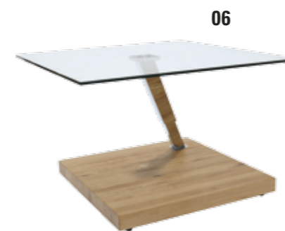
06. Couchtisch Contur® K 491 Glas kombiniert mit Holz und das Ganze noch höhenverstellbar (43 cm und 46 cm) und rollbar? Da bleiben keine Wünsche offen ...