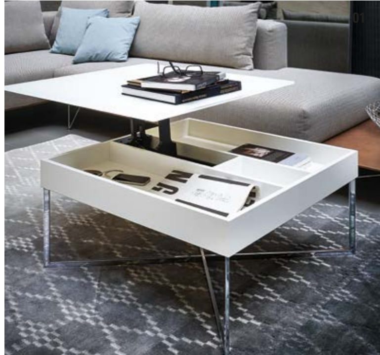
01. Couchtisch Contur® K 449, Platte reinweiß lackiert mit Nanostruktur, Holzkorpus MDF in reinweiß, Kreuzgestell Hochglanz verchromt, aufklappbar, BHT ca. 90x38x90 cm bzw. ca. 123x60x90 cm.