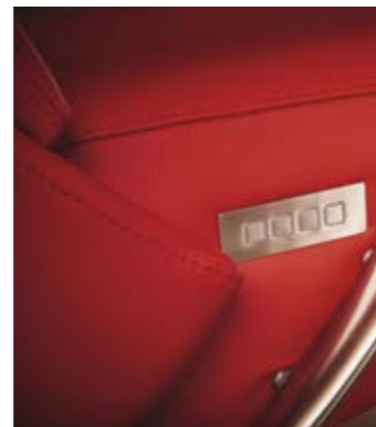
Contur® Girona , Bedienfeld Sessel