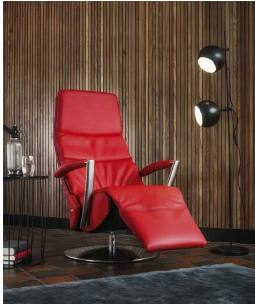
Relaxessel Contur® Girona TW 25 , Leder rot, 3-motorige Verstellung, Herz-Waage-Funktion*, Armlehnen Edelstahl lederbezogen, Tellerfuß Edelstahl optional, Sitzhöhe ca. 46 cm, BHT ca. 69x116x83 cm