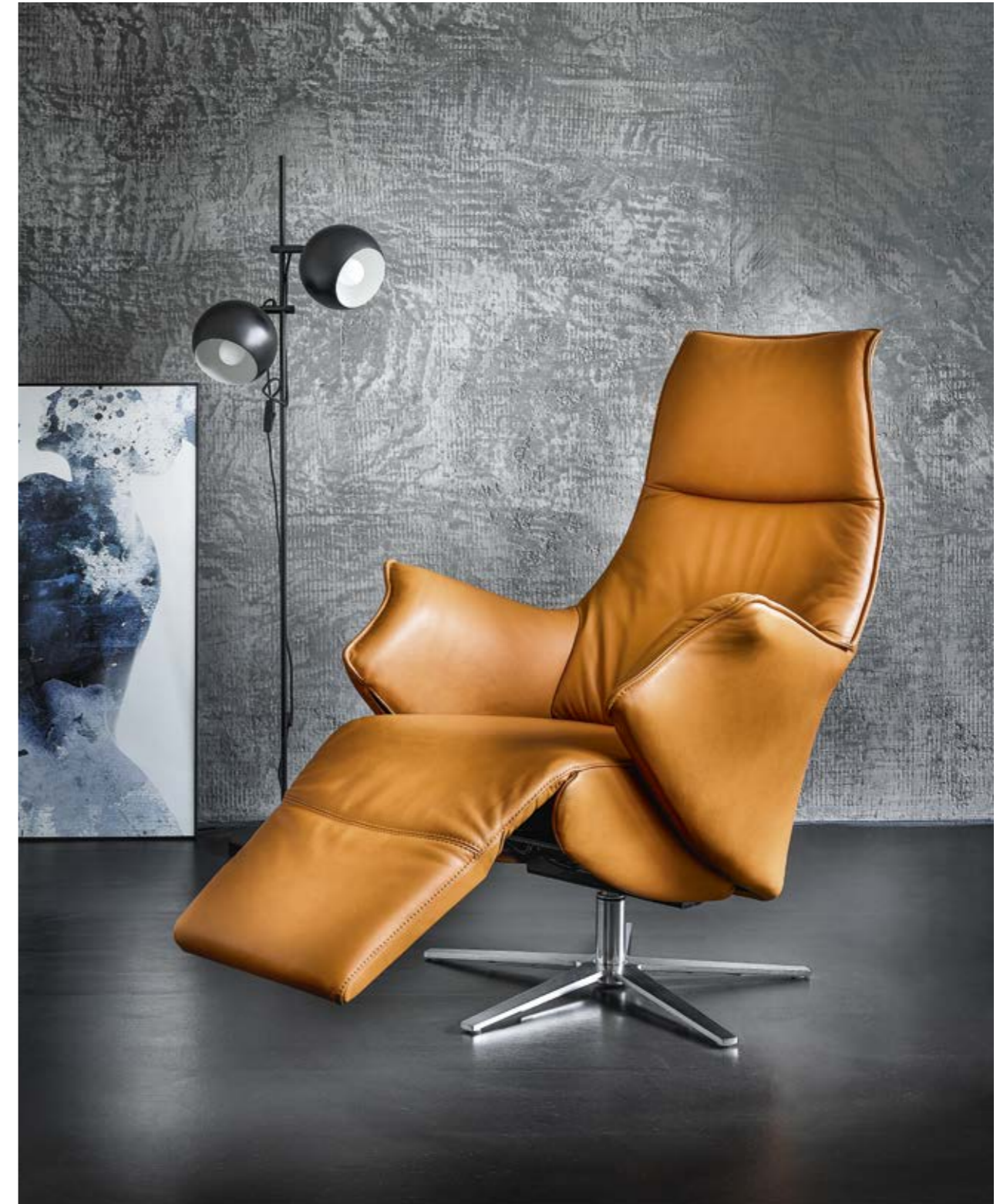
Relaxessel Contur® Girona TW 089 in echt Leder rehbraun, 3-motorige Verstellung, Herz-Waage-Funktion*, Kreuzfuß in Edelstahl, BHT ca. 81x121x80 cm

*Die Herz-Waage-Position ist eine Liegeposition, bei der die Fußspitzen höher liegen als das Herz. Dementsprechend nehmen Sie eine sehr angenehme und durchblutungsfördernde Position ein.