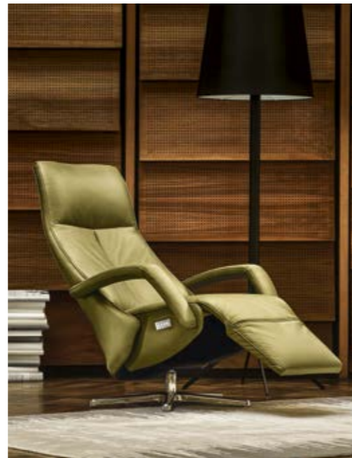
Relaxessel Contur® Girona TW 32 , Leder, 3-motorige Verstellung mit Akku, Herz-Waage-Funktion*, Armlehnen gehen mit dem Rücken nach hinten, Sternfuß Aluminium poliert, Sitzhöhe ca. 46 cm, BHT ca. 74x113x86 cm